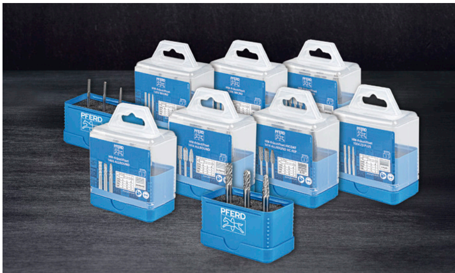
Bild 1 Sieben neue Sets mit Rennersorten - jetzt erhältlich von PFERD

Anzahl Zeichen 2,286 (inkl. Leerzeichen)